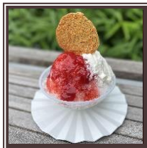
Shaved Ice (Strawberry milk)