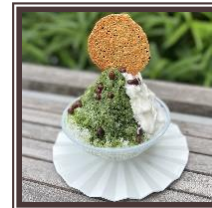
Shaved Ice (Greentea milk)